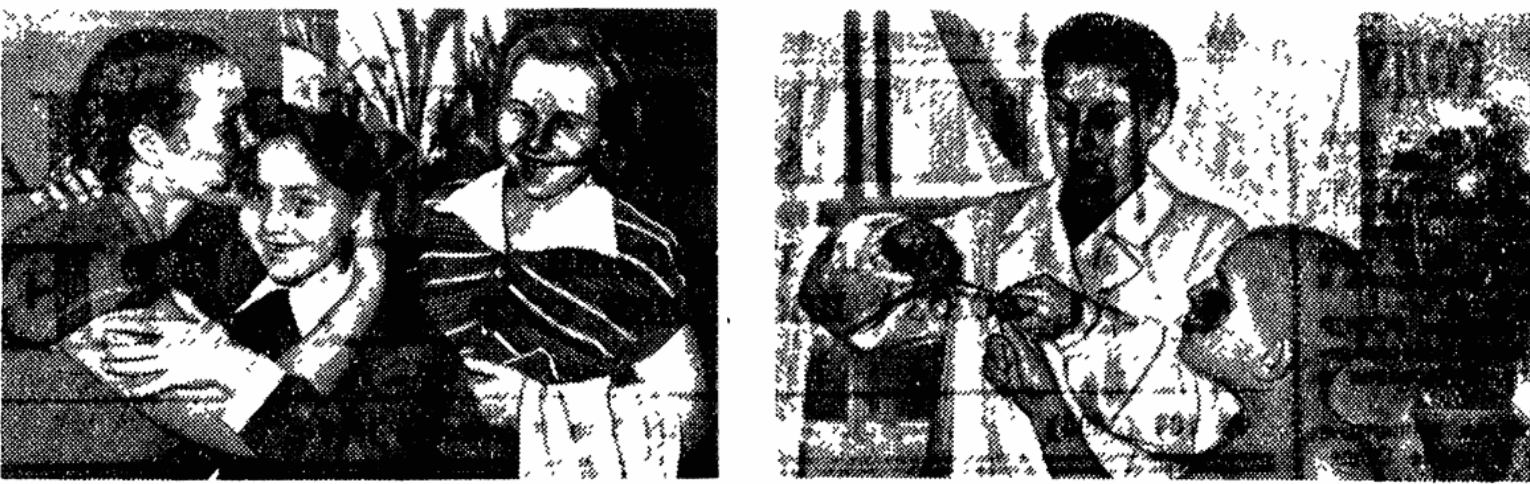
До свидания — до воскресенья!