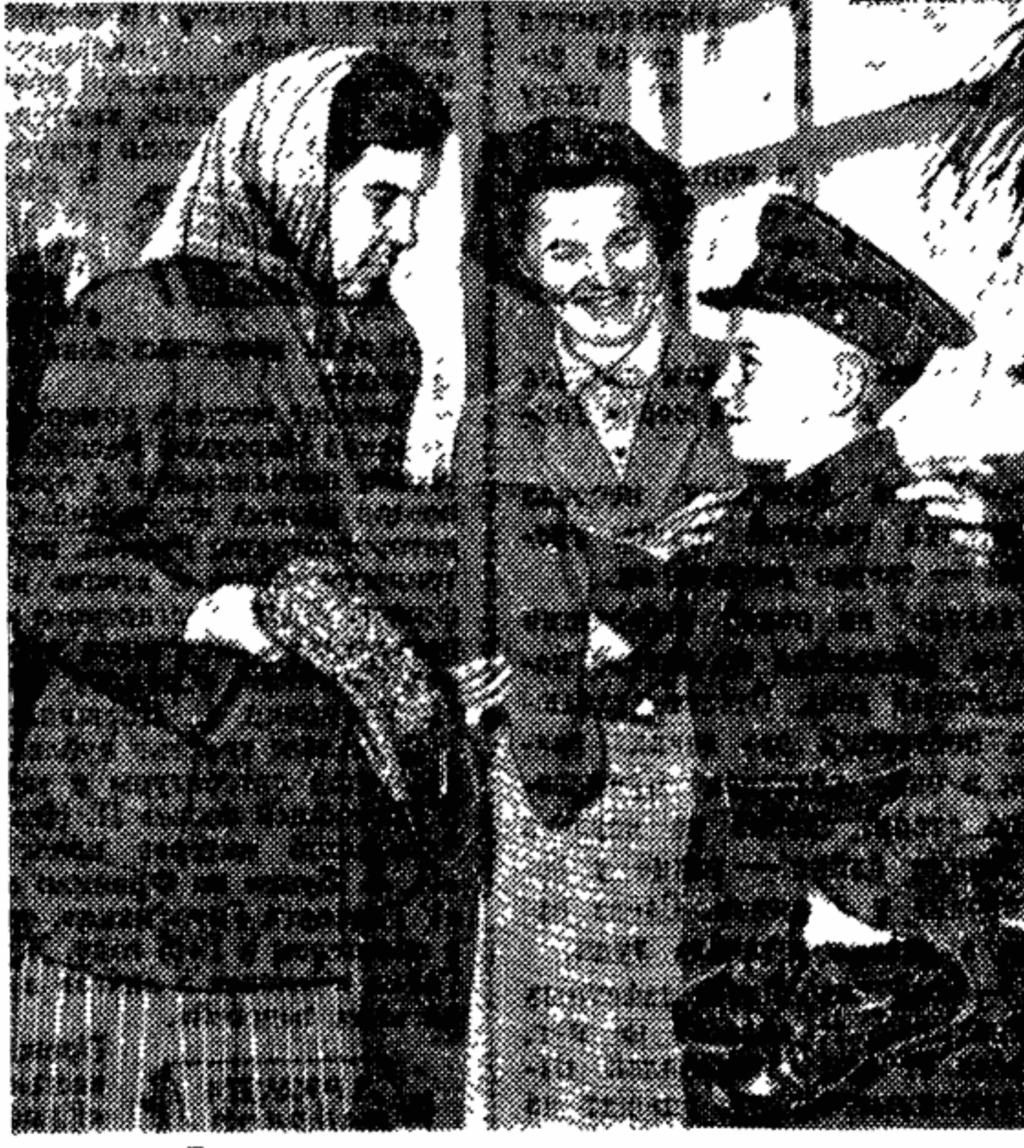
Теперь это останется только на память.